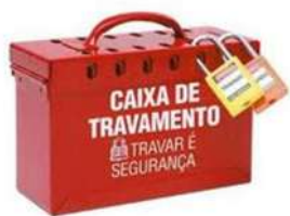
Modelo de caixa de bloqueio

Procedimento de Bloqueio mecânico e elétrico (ver detalhes no item dedicado aos profissionais da elétrica): PROCEDIMENTO DE descarga da energia potencial e residual, Bloqueio físico (travas/cadeados/válvulas), Sinalização, Bloqueio do religamento automático (se houver) e Constatação de ausência de tensão/carga com uso de instrumento (quando aplicável), prevendo a existência de caixas de bloqueio coletivo/garras e cadeados individuais.