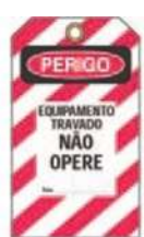
Modelo de etiqueta