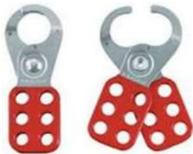
Modelo de garras para bloqueio