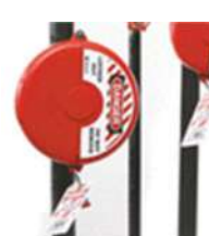
Bloqueio de válvulas